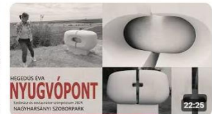
Hegedűs Éva: Nyugvópont 190 megtekintés • 1 hónappal ezelőtt