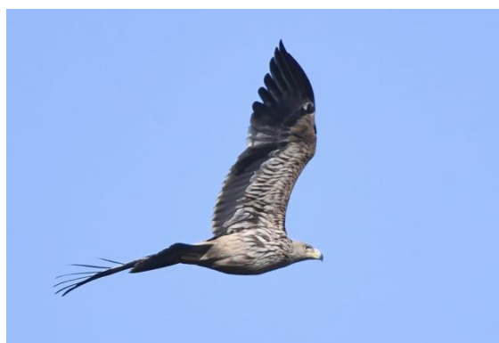
(Fotó: parlagi sas, a képet Kováts László természetvédelmi őr készítette)

Új fajok megjelenésére, ritka fajok felbukkasására több példa is volt az idei év folyamán. A Paksi ürgemezőn törpesast figyeltek meg munkatársaink. A Dunai Tájegységben két parlagi sas fészket sikerült beazonosítani, mindkét fészekben sikeres költés zajlott az év folyamán: összesen három fióka repült ki a két fészkből. Átvonuló fajokat is szép számmal kaptak lencsevégre természetvédelmi őrök, többek között az év elején a nagy lilik példányait, márciusban a kendermagos récéket. A Mecsek egyes részein április közepétől óriási tömegben bontották szirmaikat a zergevirágok.