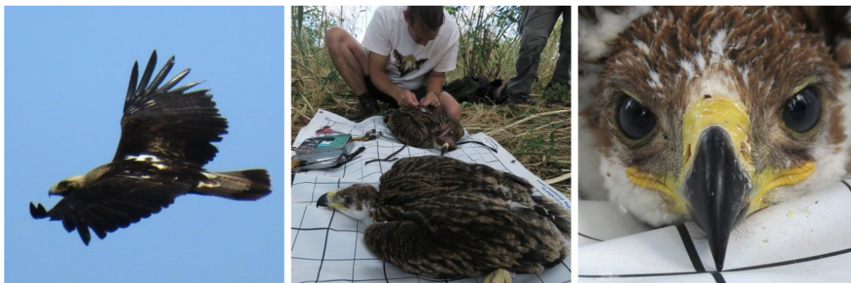
A képeken: öreg (adult) parlagi sas, a fiatal sasok jeladózás közben, pihés parlagi sas fióka (Szöveg és fotók: Mórocz Attila)

A parlagi sasok hazai állománya erősödik, elsősorban a Tiszántúlon és a Duna-Tisza közén fészkel jelentős számban, illetve a Kis-Alföldön van jelen. A faj terjeszkedése során várhatóan a Dél-Dunántúlon is egyre több fészkelésre lehet számítani a közeljövőben.