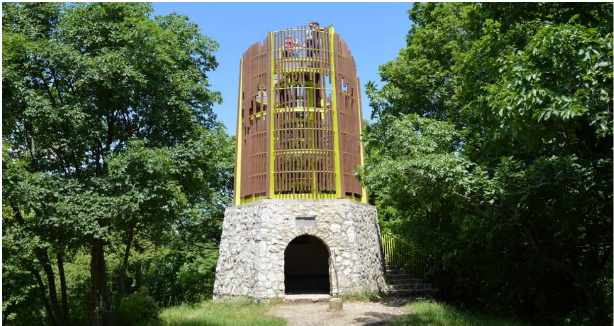
A megújult Cigány-hegyi kilátó

A projekt most átadott építményeit is magába foglaló második részét a Natura 2000 bemutatási infrastruktúra építmények létrehozása jelenti a DDNPI szinte teljes működési területén. Ez a projektrész 2020 őszén indult és 2021 októberében fejeződött be. A létesítmények jellegét, számát tekintve igen összetett építési feladatok valósultak meg. Elsősorban fa építőanyagból, tájba illesztett, formavilágában egységes arculatot sugárzó, kisebb-nagyobb építmények készültek el.