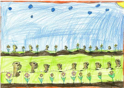
Csille Luca Sára alkotása