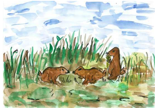
Lovász Dániel alkotása