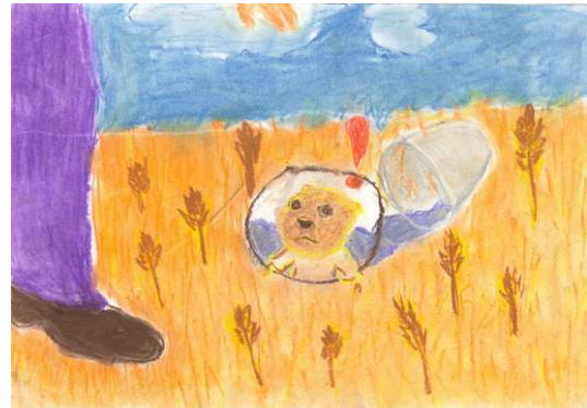
Juhos Kiss Csaba alkotása