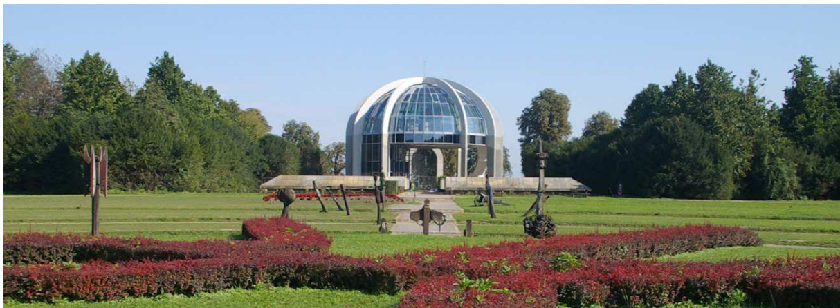
A Mohácsi Nemzeti Emlékhely

Facebook: www.facebook.com/emlekhelyeknapja