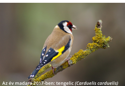
Az év madara 2017-ben: tengelic ( Carduelis carduelis )

Október 1. IDŐSEK VILÁGNAPJA A PINTÉR-KERT ARBORÉTUMBAN Helyszín, időpont: Pécs, Pintér-kert Arborétum, 10.00 és 14.00 óra