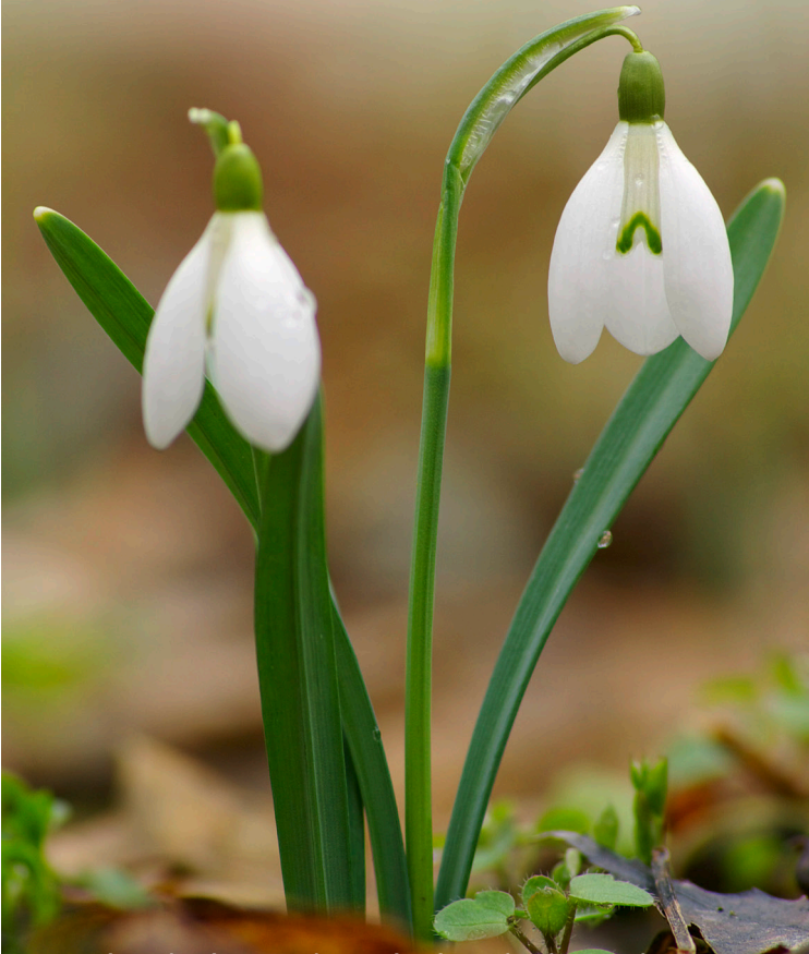
Az év vadvirága 2017-ben: Hóvirág ( Galanthus nivalis )